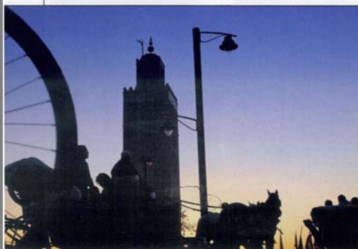
△Partecipante alla prima edizione del Workshop a Marrakech. Reportage geografico: la fotografia di viaggio .

di un workshop di fotografia che, ancora una volta, si configura già come una vera e propria spedizione fotografica. Si intitola Workshop a Marrakech. Reportage geografico: la fotografia di viaggio e si svolgerà presso il Riad Sahara Nur di Marrakech. Si tratta di un corso intensivo pensato appositamente sia per gli appassionati di fotografia e di viaggi,