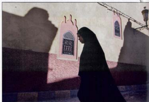
△© Roberto Bianchetti. Partecipante alla prima edizione del Workshop a Marrakech. Reportage geografico: la fotografia di viaggio .

sia per i professionisti che aspirano a cimentarsi nel fotoreportage di viaggio. Proprio per questo motivo, tale workshop verrà strutturato in modo di massimizzare l'esperienza di lavoro sul campo, offrendo un programma didattico articolato in sedici ore di lezioni teoriche, dodici ore di esercitazioni pratiche guidate e sedici ore di esercitazioni individuali. Per un proficuo svolgimento del corso è consigliato l'uso di attrezzatura fo-